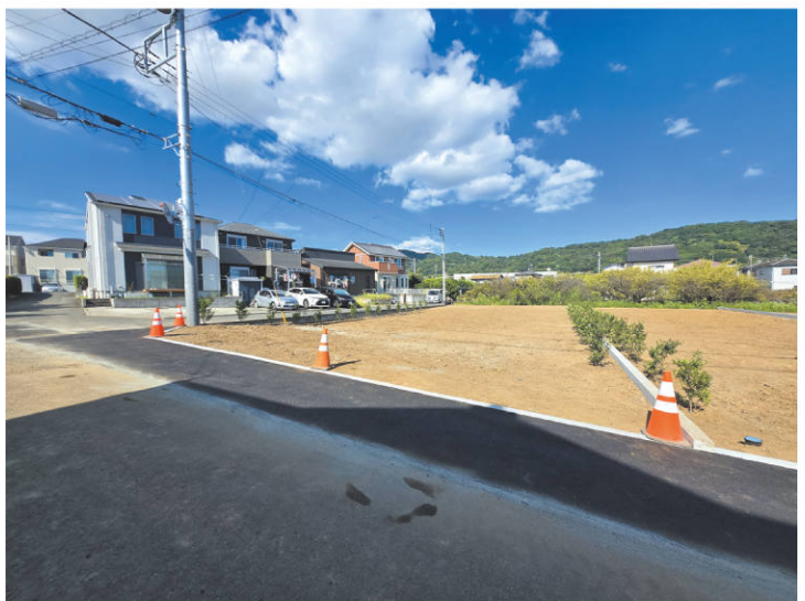
【全区画図 | Land Landscape】